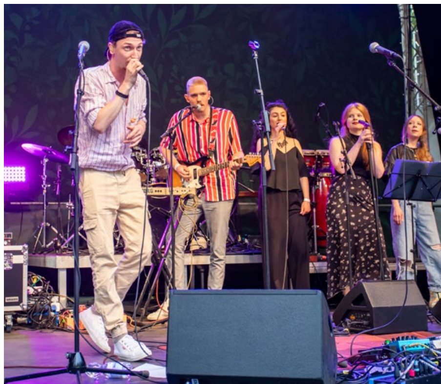
Mit dabei am Freitag: das Duo Florettfechten mit deutschsprachigem 80er-Jahre-Synthipop.