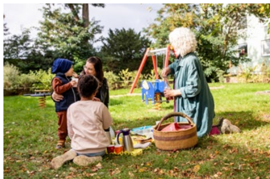
Am Spielplatz gibt es nun auch Picknick-Treffen.