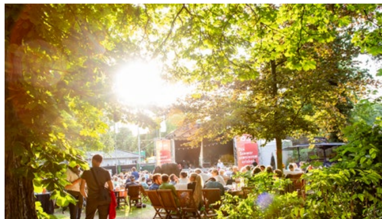
Livemusik im Grünen: Im Wolters Applaus Garten saßen wieder viele entspannte Runden zusammen.

U mgib dich mit Leuten, die dich froh machen. Fröhlich sein ist Reichtum: Diese Lebensfreude war auch in diesem Jahr wieder bei den BBG-Sommerabenden spürbar. Ausgelassenes Tanzen vor der Bühne, anstoßen mit Apfelschorle, Wein und Bier, geschwenkte Glühbirnen in der Dämmerung, lockere Gespräche mit Familie, Freunden und Nachbarn. Im Mittelpunkt stand natürlich die Livemusik. Am Freitag hieß das Motto „Oldschool meets Newschool“, mit Hits von The Beatles bis Billie Eilish. Am Samstag ging es rockklassisch zu, mit Rock, Soul und Blues. Hier schauen wir noch einmal zurück – und freuen uns schon auf die Fortsetzung im nächsten Jahr.