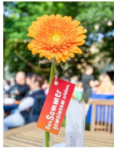
Blumen zur Begrüßung