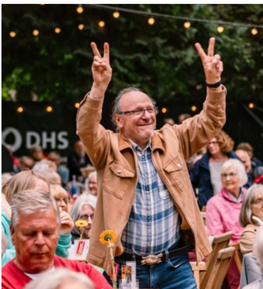
Viele riss die Musik von den Stühlen. Einige schwenkten auch Glühbirnen.