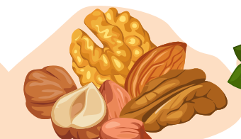
Mandeln oder Nüsse