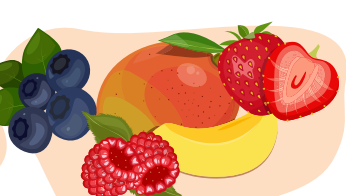
Früchte, püriert oder in Stückchen