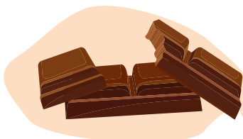
Schokoladenstückchen oder Streusel

Zutaten, mit denen du dein Eis verfeinern kannst: