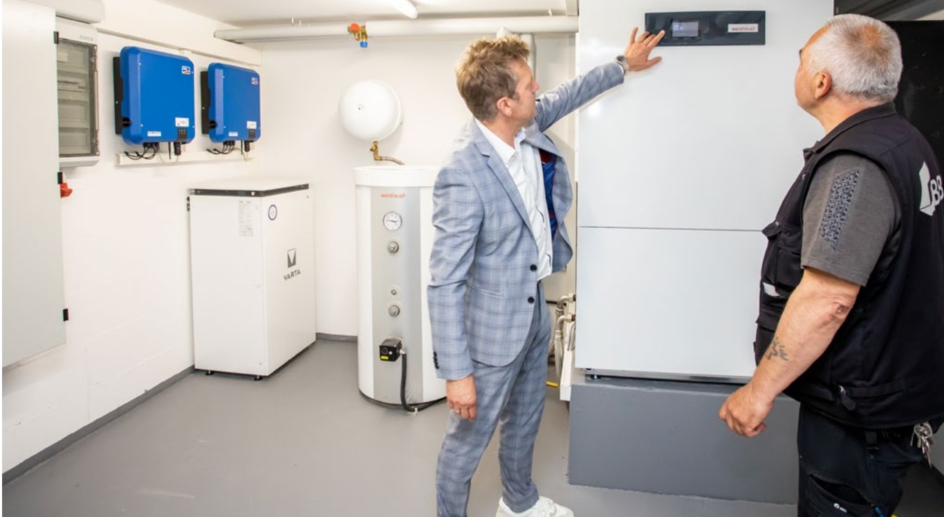
Im Neubau ist neben der Photovoltaikanlage mit Batteriespeicher auch eine Wärmepumpe im Einsatz.